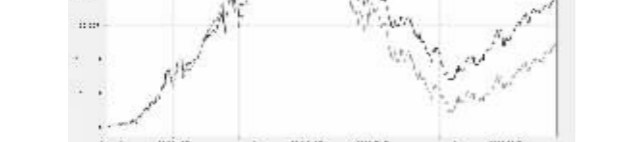
注:1.根据《华安宏利股票型证券投资基金合同》规定,本基金自基金合同生效日起6个月内...

2009年6月30日 基金管理人:华安基金管理有限公司 基金托管人:中国建设银行股份有限公司 报告送出日期:二〇〇九年七月十八日